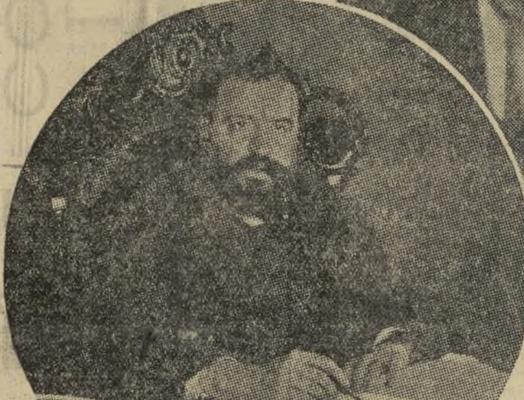
Blasco Ibañez director de EL PUEBLO en Valencia. La mano ancha y fuerte de luchador traza sobre las cuartillas — letra firme, rápida y vigorosa — palabras que eran fuego y látigo.