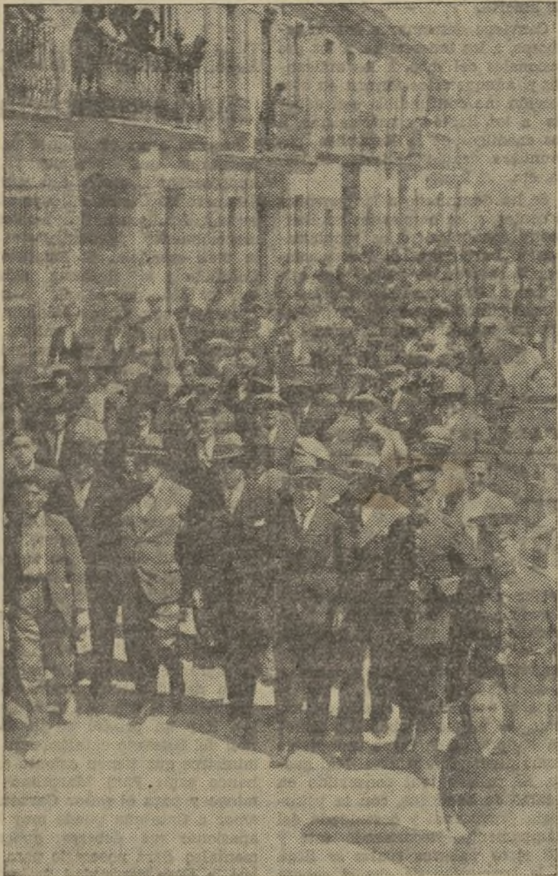
LLEGADA DE LAS AUTORIDADES A CAMPANAR

El pasado domingo, el poblado de Campanar, cerró solemnemente su triunfal conmemoración de la proclamación de la República con un acto de emotiva afirmación republicana al honrar a los patrios republicanos y a la destacada figura nacional de don Alejandro Lerroux y la universal del insigne don Vicente Blasco Ibáñez. El poblado de Campanar, de abito largo republicano y de ralgambre