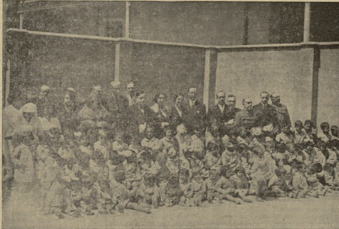
LA GUARDERIA DE NISOS DE LA CALLE DE SAGUNTO, VISITADA OFICIALMENTE POR LAS AUTORIDADES DE VALENCIA EL DIA 30 DEL PASADO

largas tramitaciones la resolución de problemas tan agudos y graves, no vamos a hacer nada y dejándolos llevar de su carácter y de su juventud interviene en los asuntos, pero en éste ha oído todas las opiniones y no ha querido intervenir dejando que se ultimase por completo el asunto como ha ocurrido con la votación y sólo cuando su opinión no puede coaccionar moralmente a ningún concejal es cuando se ha determinado a terciar en el asunto y aclarar por cortesía y por respeto a la minoría que ha intervenido.