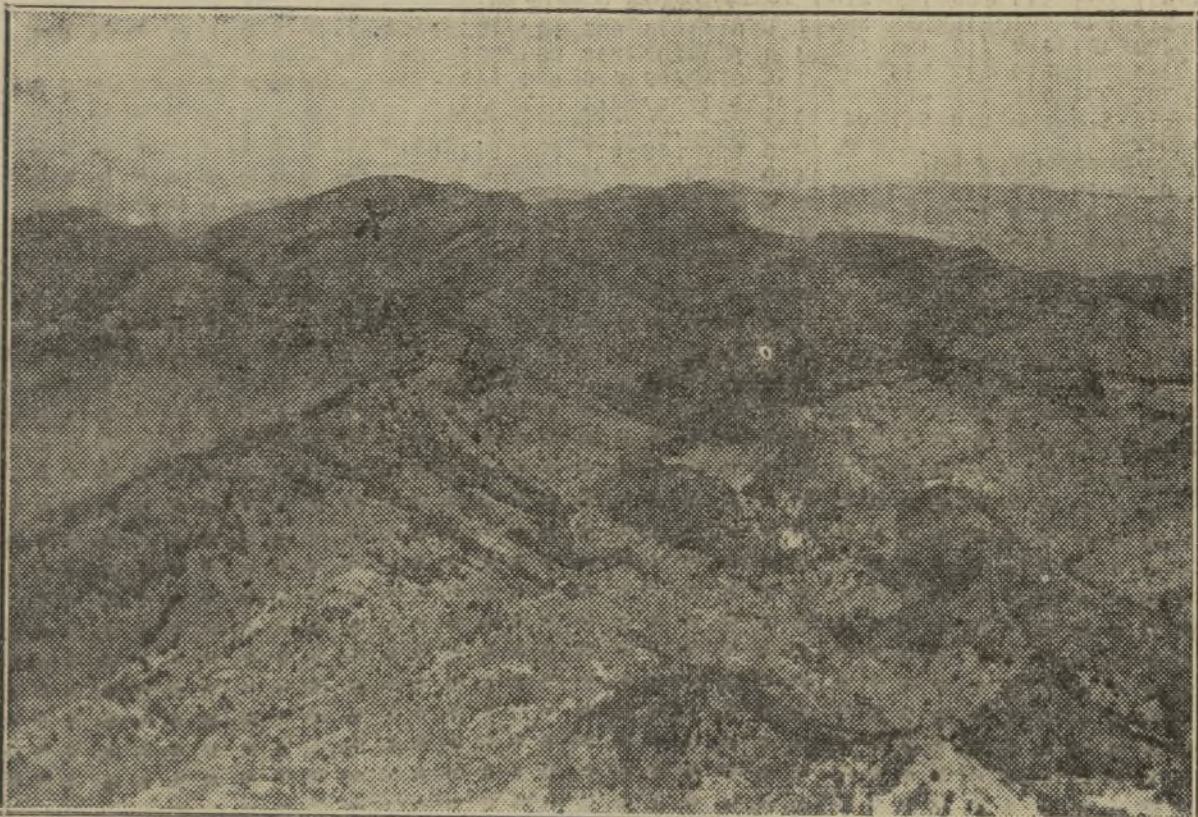
Vista general de El Garbí desde el camino de la fuente de Barrax. El lugar señalado con una cruz indica el punto donde está emplazada la masía en que ocurrió el crimen.

la aparición de tres jóvenes, uno con americana negra y dos vestidos de mecánico, quienes por las apariencias y la forma de saludar, demostraban ser educados. Solicitaron un trozo de pan y un