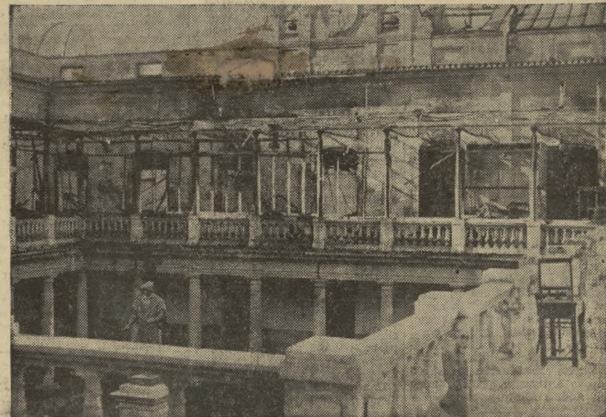
ESTADO EN QUE QUEDARON LOS LABORATORIOS DE QUIMICA GENERAL Y ANALISIS, DESPUES DEL SINIESTRO.

Vimos y vieron todos nuestros amigos, bien claramente, actuar