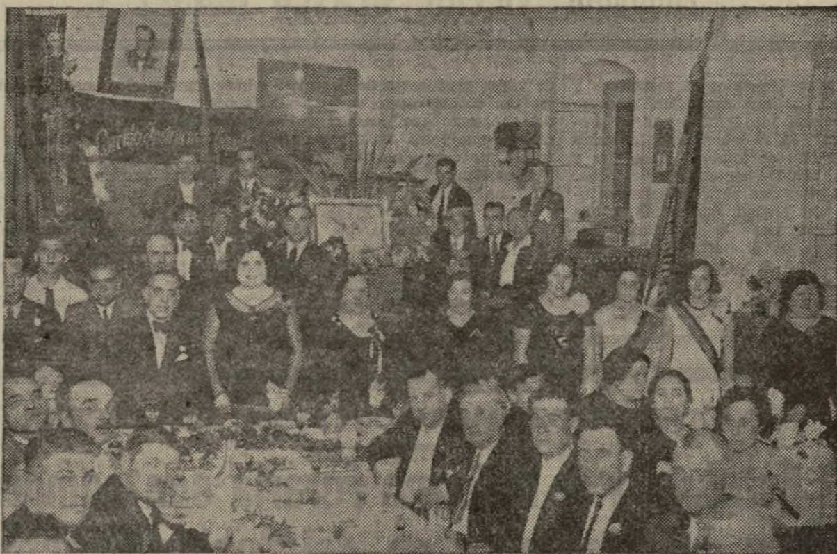
LA AGRUPACION FEMENINA LOS MUERTOS MANDAN, OFRECIO EL PASADO DOMINGO AL GENERAL RIQUELME FERVIDO HOMENAJE AL QUE SE ASOCIARON TODOS LOS ORGANISMOS REPUBLICANOS DE LA CAPITAL EN BRILLANTE VELADA DIGNA DEL ENALTECIDO E ILUSTRE GENERAL

El pasado domingo a las diez de la noche, tuvo lugar en el local del Casino Republicano de la calle de Burjasot un acto en honor del Comandante general don José Riquelme, organizado por la Agrupación Femenina del distrito del Museo, Los Muertos Mandan.