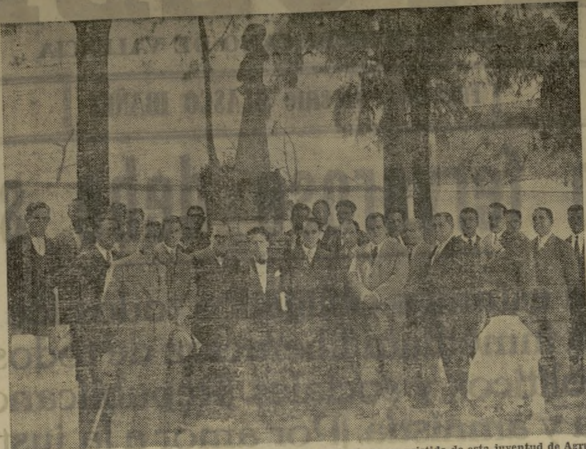
En el Cementerio Civil, la tumba de Constantino Llombart, se ve asistida de esta juventud de Agrupación Valencianista Republicana, que en su aniversario honra el recuerdo del autor de «Filles de la Morta Viva»

¿Cuánto han concedido los gobiernos de la monarquía a Valencia para construir la Escuela de Trabajo en nuestra ciudad?