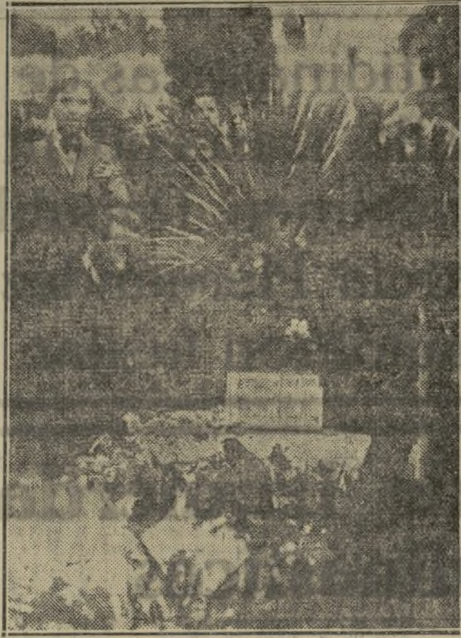
Los ferroviarios depositan coronas en la tumba del capitán Galán

dez y en las sepulturas de los soldados y el chófer de la columna de Galán.