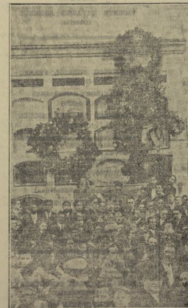
Los ferroviarios depositan coronas en el nicho del capitán García Hernández

dera de la Libertad, en su lucha secular contra la tiranía, en nuestra España, inclinados ante las tumbas provisionales de los Mártires de Huesca, sentimos el vértigo de las cimas inaccesibles de la gloria y, a la vez, recibimos el aliento necesario para coronar, cueste lo que cueste, la obra libertadora que tan generosamente emprendieron. ¡Sangre fecunda la de Galán y García Hernández! España entera ha sentido las sacudidas y en reacción de civilidad ciudadana, puesta en pie, exige imperiosamente al Poder que las inmóvil que deje el paso franco a la Libertad y a la Justicia. No es hora de lamentación.