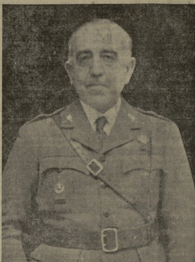
El general de división republicano don José Riquelme, que ayer tomó posesión de la comandancia general de Valencia.

Valencianos: ¡Viva la República! ¡Viva España!”