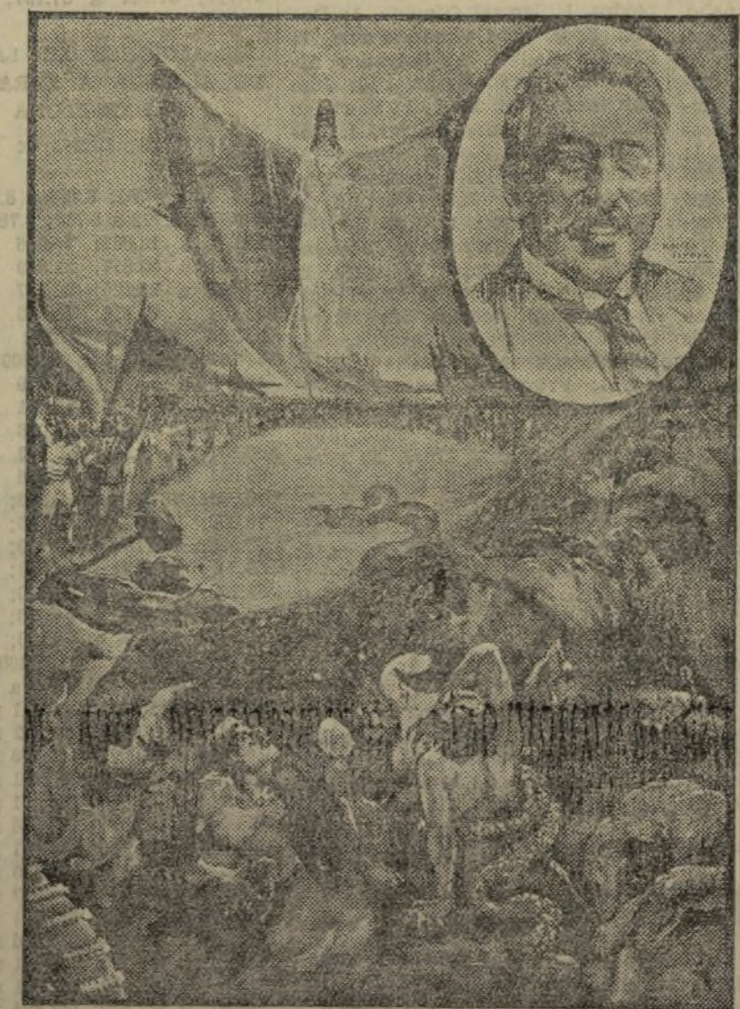
Lámina conmemorativa de la República

Verdadera joya artística, con retratos al lápiz de Fermín Galán, García Hernández, Blasco Ibañez, Alcalá Zamora, Miguel de Unamuno y Fernando Valera, que constituye el más delicado recuerdo de la gesta revolucionaria de Diciembre y del advenimiento de la República española.