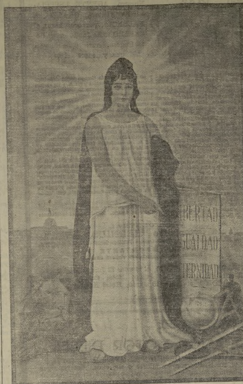
Tamaño 77 por 110, ocho ptas.; tamaño 54 por 84, seis ptas.

La alegoría más indicada para ayuntamientos, diputaciones, juzgados, oficinas del Estado, centros republicanos, etc., etc.