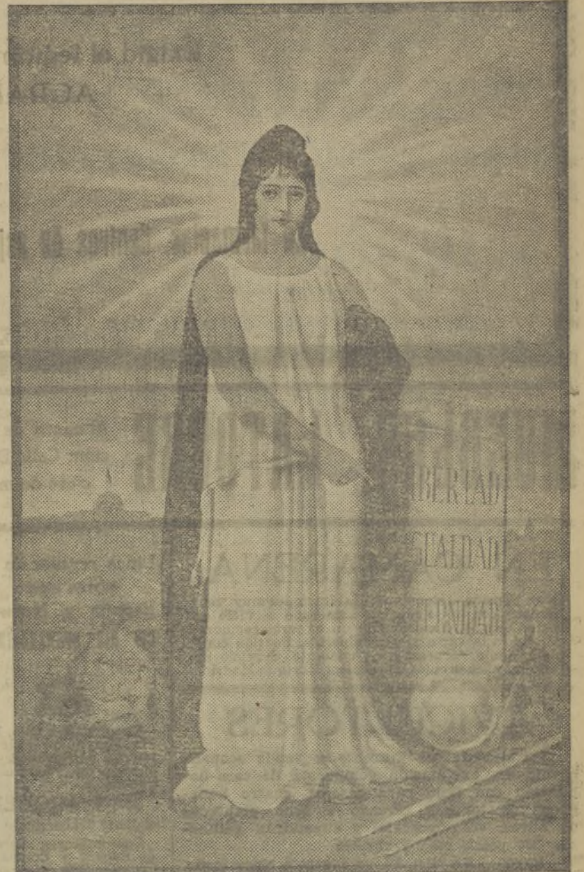
Tamaño 77 por 110, ocho ptas.; tamaño 54 por 84, seis ptas.

(Procedimiento OFFSET.—Símil aguafuerte) La alegoría más indicada para ayuntamientos, diputaciones, juzgados, oficinas del Estado, centros republicanos, etc., etc.