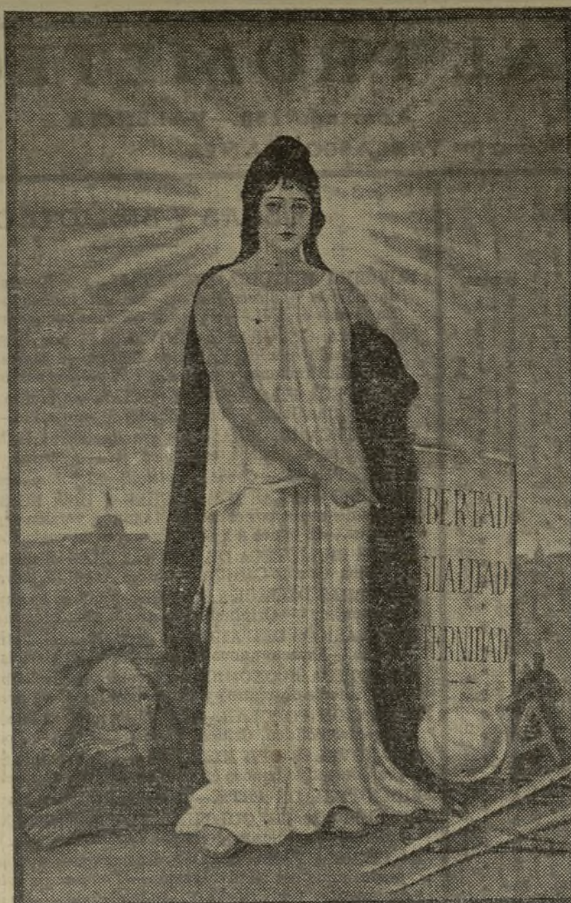
Tamaño 77 por 110, ocho ptas.; tamaño 54 por 84, seis ptas.

La alegoría más indicada para ayuntamientos, diputaciones, juzgados, oficinas del Estado, centros republicanos, etc., etc.