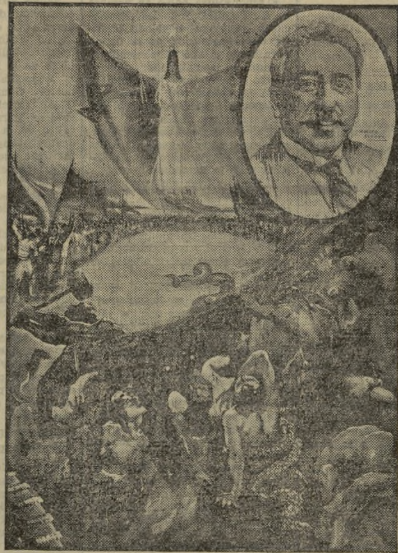
Lámina conmemorativa de la República

LA HUERTA VALENCIANA Calle de la Linterna, 21, entresuelo (ENCIMA DE LA FÁBRICA DE CAJAS DE CARTÓN)