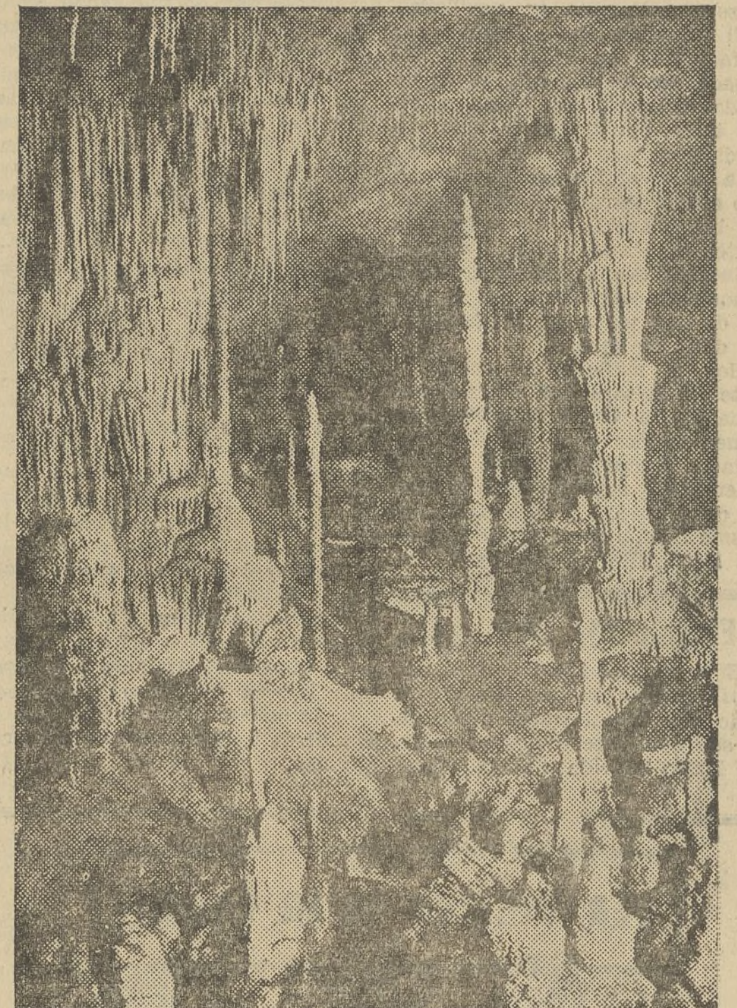
TEATRO DE LAS HADAS EN LA CUEVA DE LOS FRANCESES

Estas palabras son acertadísimas, y tal es la impresión que se sufre apenas se ha salvado la entrada y se ha penetrado a unos cinco metros de profundidad cuesta abajo, luego de traspasar un ancho vestíbulo iluminado por la luz del día y penetrar en la negra sima debajo de la tierra.