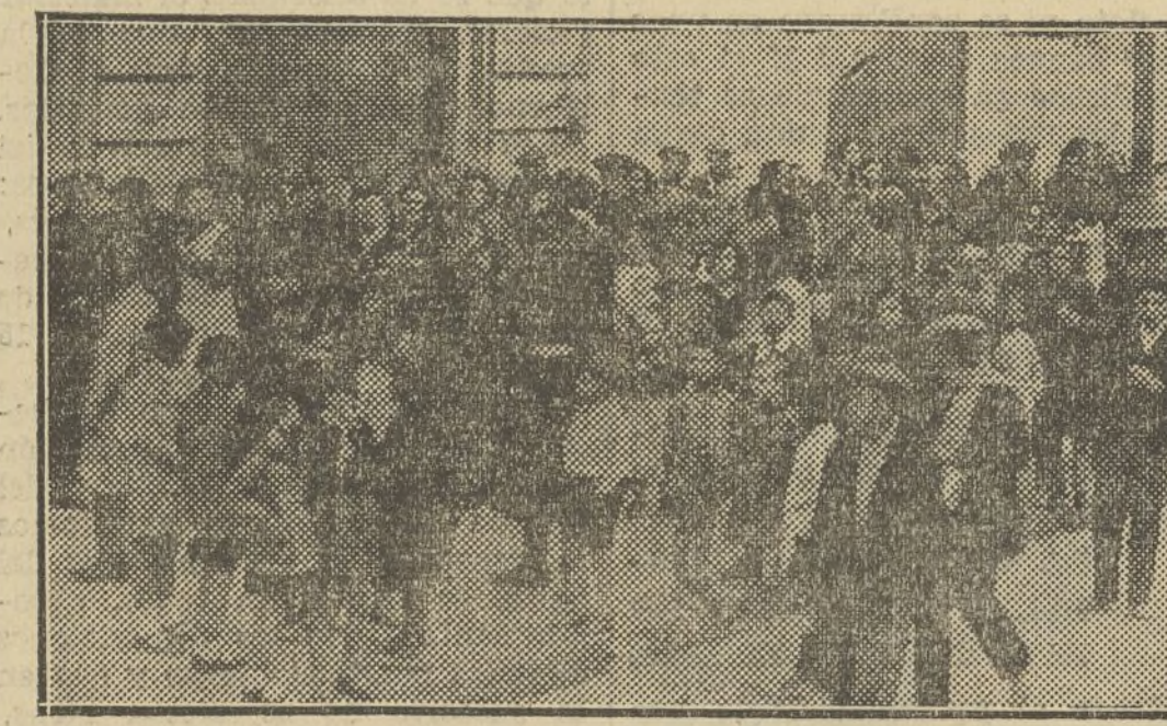
AMOR Y PIEDAD, ENALTECE ESTE MOMENTO EN QUE LOS HUMILDES ESPERAN ANTE LA CASA DE LA DEMOCRACIA EL DONATIVO DE NUESTRO ROPERO REPUBLICANO AUTONOMISTA

El Ropero Autonomista ha extendido considerablemente su radio de acción y hoy sus beneficios