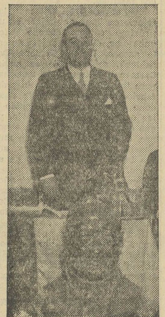
EL PRESIDENTE DEL CONSEJO FEDERAL DON SIGFRIDO BLASCO, DA COMIENZO AL ACTO. EL BUSTO DEL MAESTRO ANIMA SU ESPIRITU

Elogia la intervención de la mujer en la política y dice que su