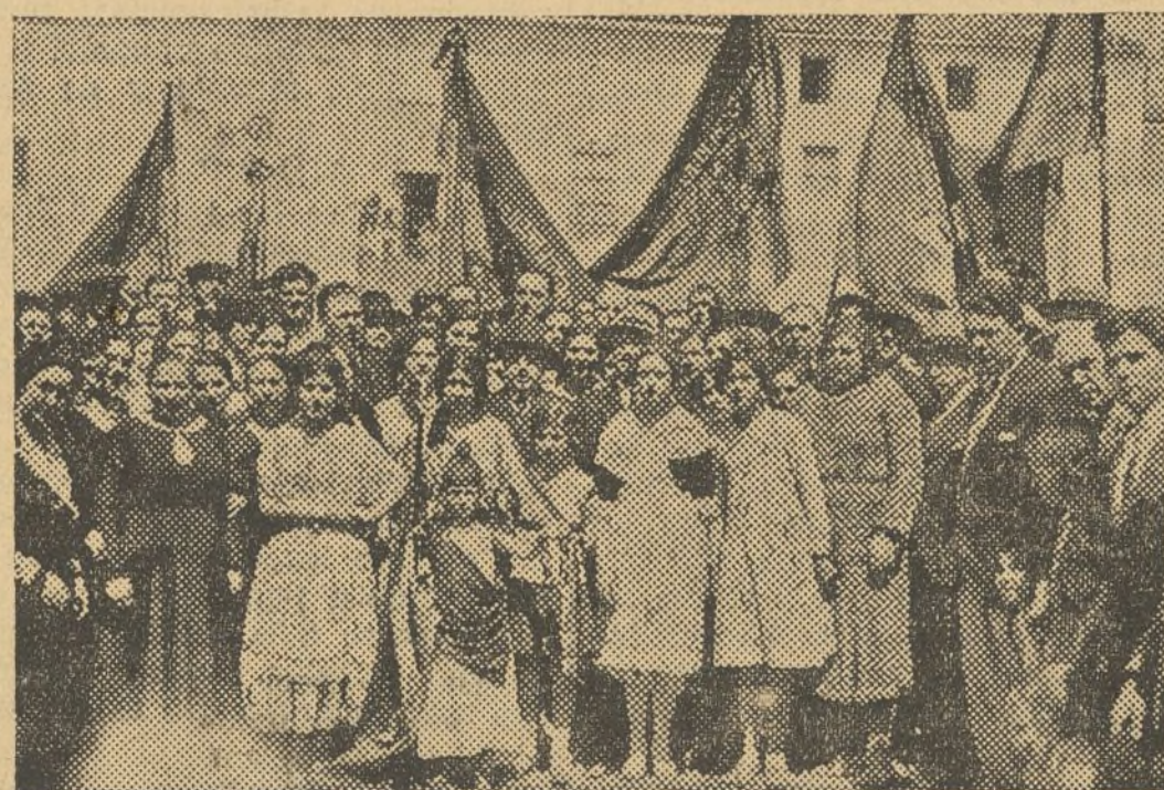
Momento en que la presidencia de la comitiva, con el Ayuntamiento en corporación, llegaron a la plaza de Patraix para inaugurar las mejoras urbanas de aquel poblado.

Vivas y una explosión de entusiasmo por parte del público fué el digno remate a la obra que acababa de ser inaugurada. La Banda Municipal interpretó el himno nacional y la multitud llena de agradecimiento al señor Gisbert y al Partido de Unión Republicana, no cesaba de vitorearlos.