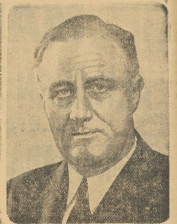
MR. ROOSEVELT presidente de los Estados Unidos de América

Materiales de construcción Sandalinas Avenida Puerto, 6. Tel. 10.241