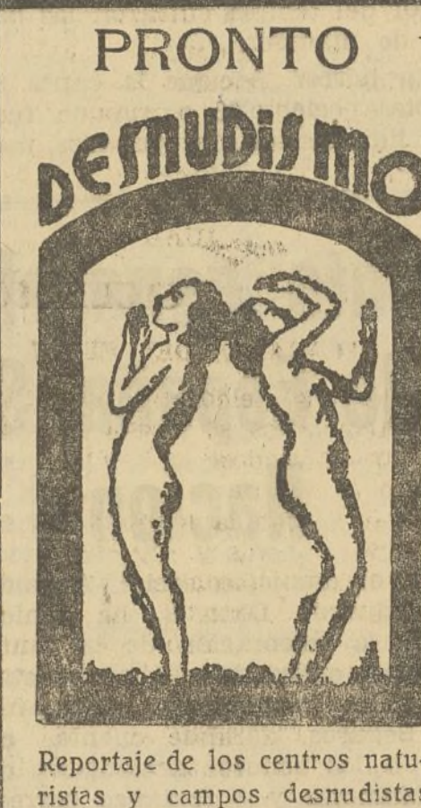
Reportaje de los centros naturalistas y campos desnudistas