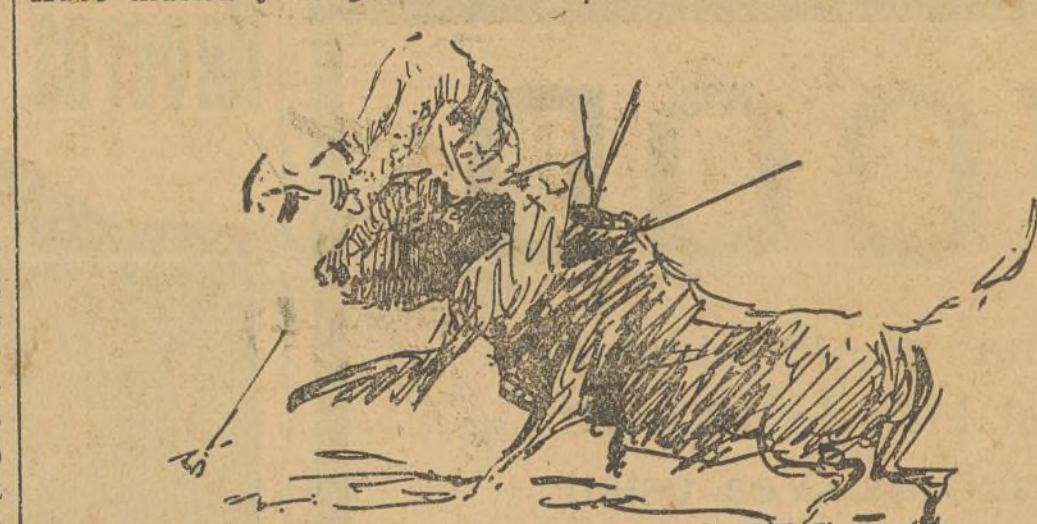
COGIDA DE VARELLITO II AL MULETEAR A SU SEGUNDO TORO

Tuvo suerte con el lote y dentro de las posibilidades aya, aprovechó cuanto pudo las buenas cualidades de sus enemigos. Al primero suyo le dió una serie de verónicas en la que anotamos