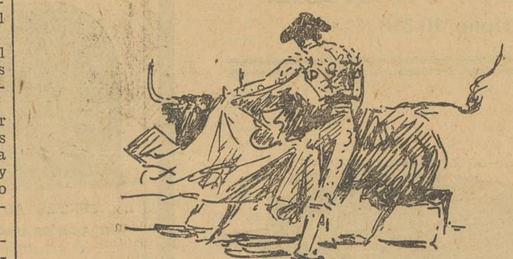
GOMEZ LAINE TOREANDO POR VERONICAS EN UN QUITE

tres matadores se lucieron en quites, destacando Laine con tres verónicas y media bien dadas.