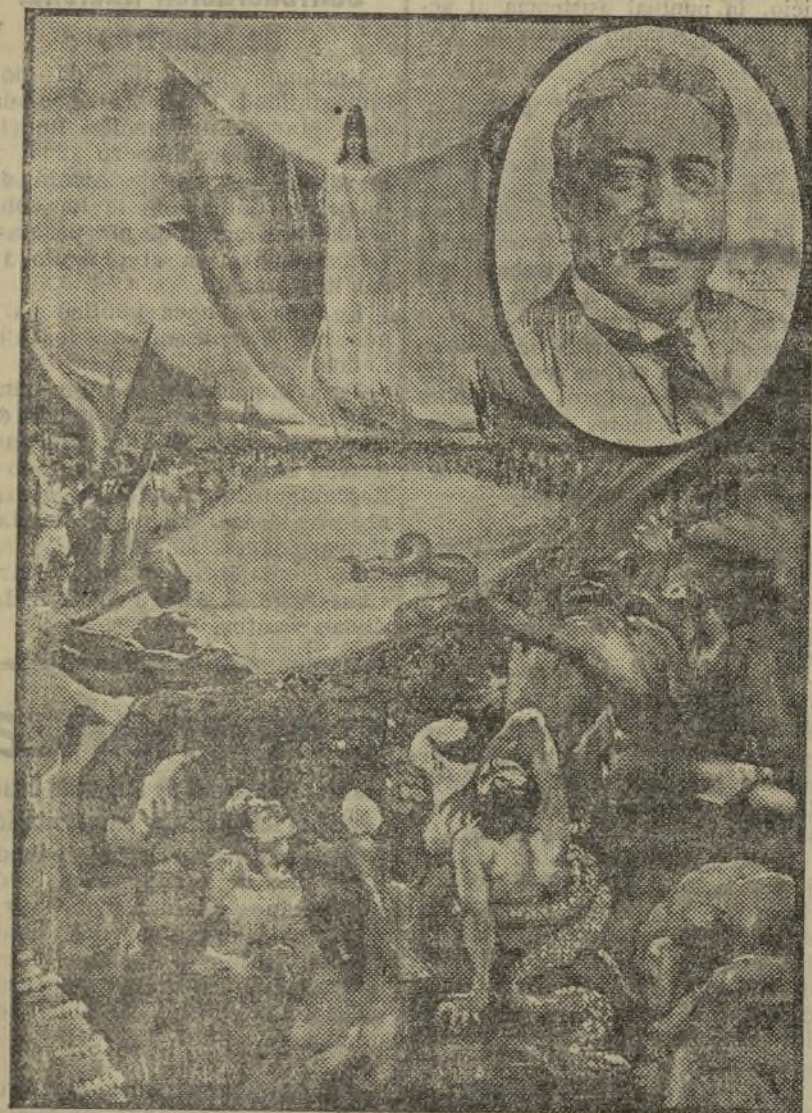
Lámina conmemorativa de la República

(ENCIMA DE LA FABRICA DE CAJAS DE CARTON)