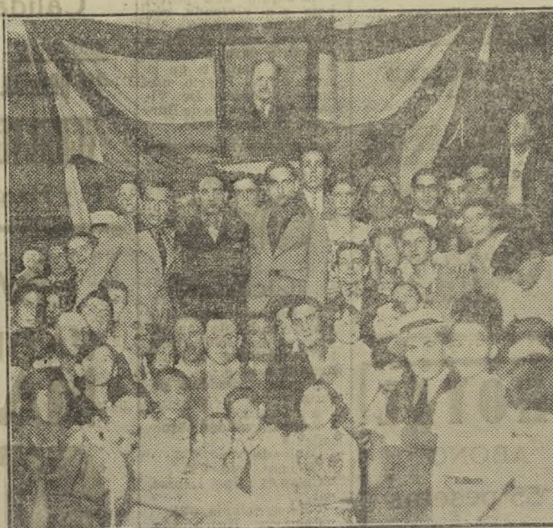
Los atletas valencianos, en el festival organizado en su honor.

Por la noche, en los sótanos del Mercado Central se celebró el festival en honor de los marchadores. El acto resultó brillantísimo.