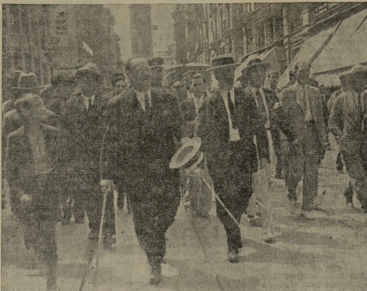
El Gobernador civil don Francisco Rubio, recorre las calles de Valencia dando órdenes acertadísimas para solucionar el conflicto planteado por los «sin trabajos».

Los pasajeros, como es natural, experimentaron cierta alarma y los grupos les tranquilizaron diciéndoles que nada les ocurriría.