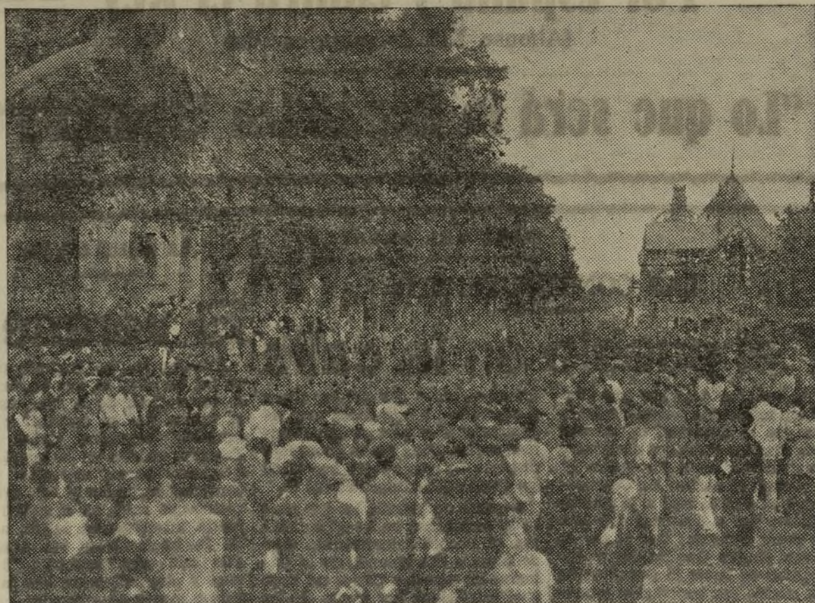
AL PATRIÓTICO GRITO DE ¡VIVA LA REPÚBLICA! DESFILAN LAS TROPAS EN LA ALAMEDA FRENTE AL GENERAL RIQUELME

El desfile fue una de las más bellas notas que hemos presenciado. Las tropas, satisfechas, sonrientes, contestaban entusiásticamente a los vivos a la República y al pasar ante la tribuna de autoridades, y ante el general que las mandaba no podía darse ni más marcialidad ni mayor prestancia.