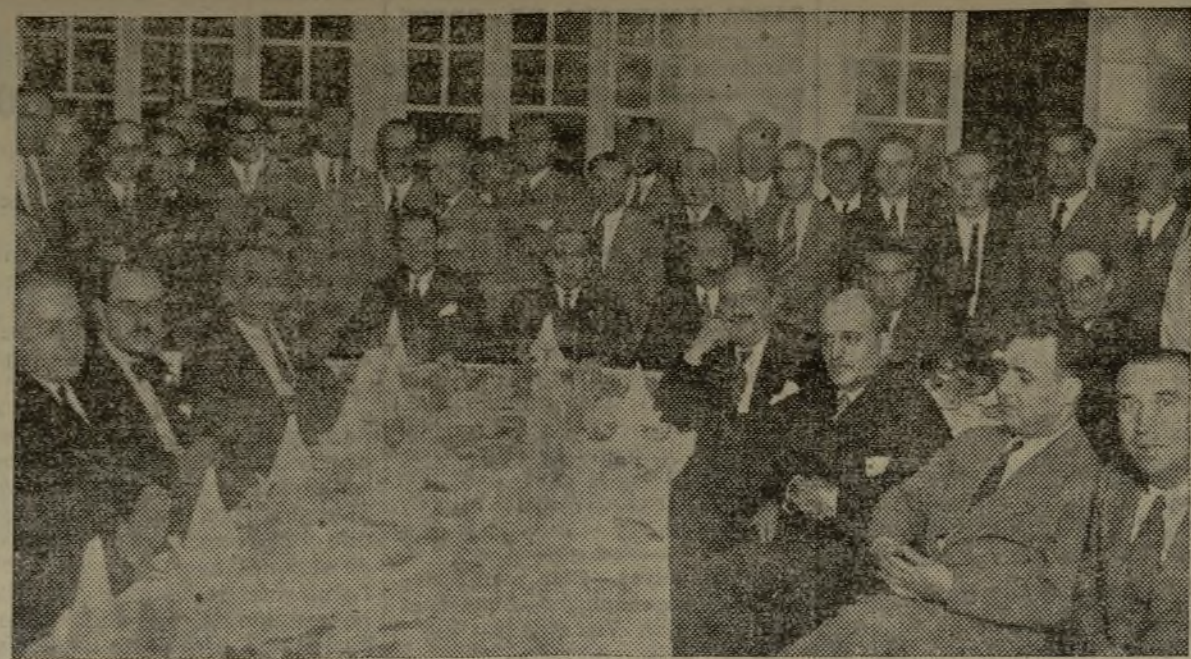
Banquete al capitán Hernando, uno de los militares más perseguidos por los anteriores gobiernos por sus ideas republicanas que nunca ocultó. El Gobierno actual ha hecho justicia a sus méritos y sus compañeros le han agasajado así, demostrándole su simpatía y adhesión. El banquete fué presidido por el general Riquelme.