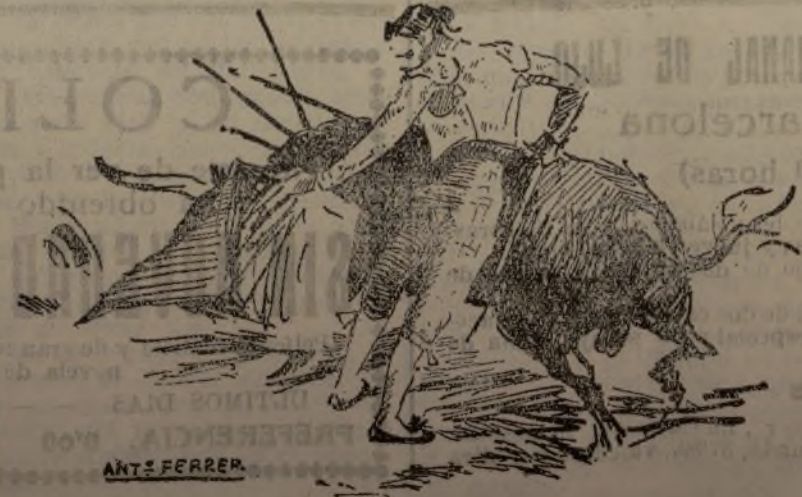
Uno de los naturales de Ortega

No hubo allí el temple finísimo, estilista, ni la suavidad que distingue a los naturales modelo,