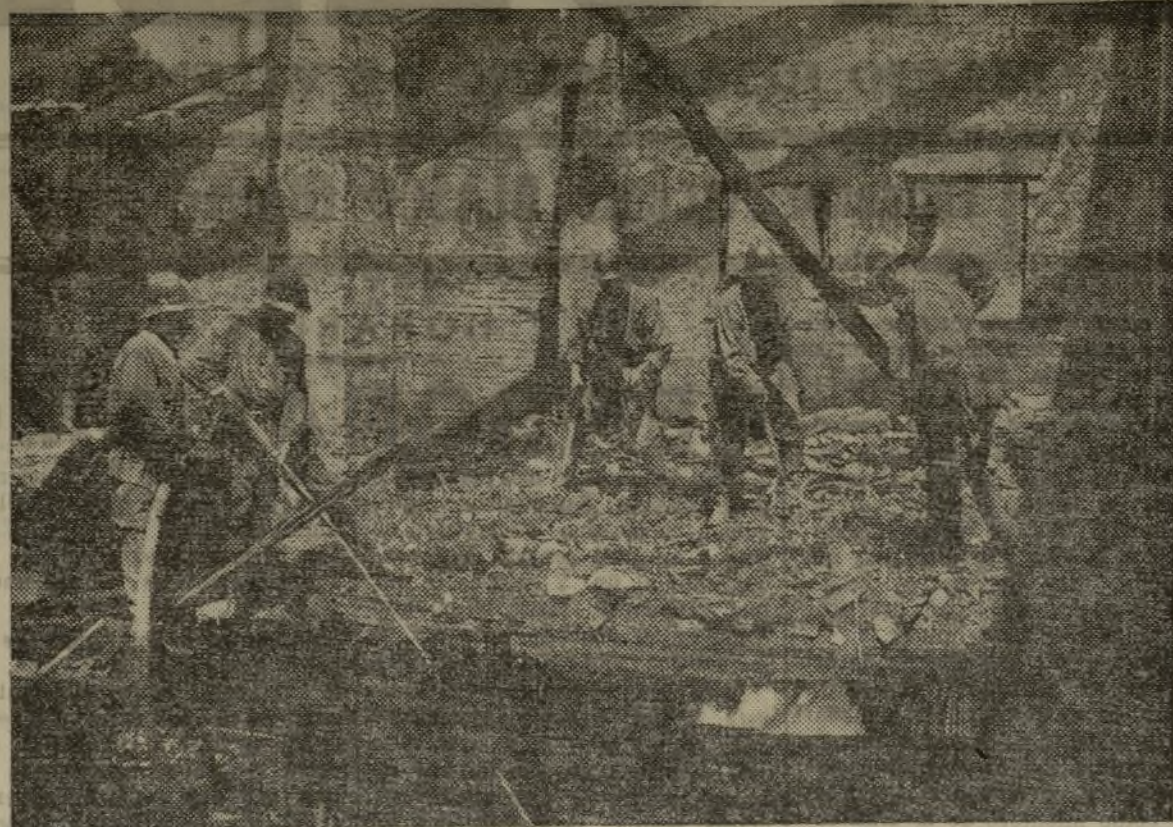
ESTADO EN QUE QUEDO LA FABRICA DE ABANICOS DE LA CALLE DE GASPARD BONO, DESPUES DE SER DESTRUIDA POR EL FUEGO