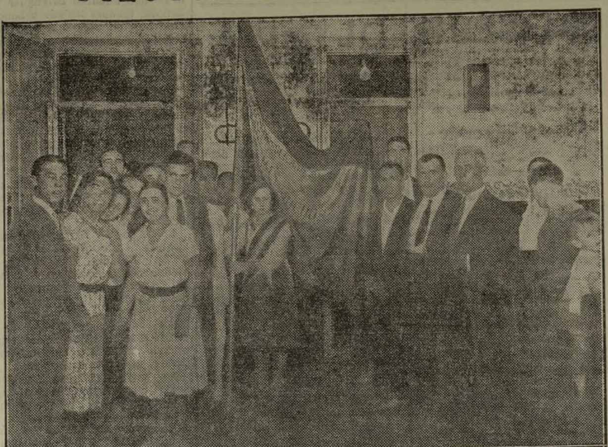
Entrega al Casino de Unión Republicana Autonomista, de una magnífica enseña nacional, bordada por las bellas correligionarias que aparecen en la fotografía.

Hace algún tiempo surgió entre un grupo de entusiastas mujeres republicanas de Masarrochos la idea de regalar una bandera al Círculo Musical, hoy de Unión Republicana Autonomista.