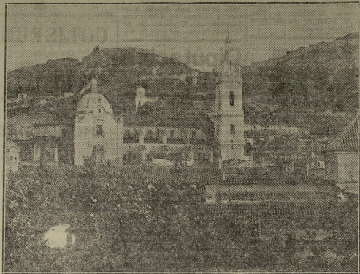
UNA DE LAS VISTAS PINTORESCAS DE JATIVA

No dejen de visitar su puesto situado en la feria, junto al Kiosco Republicano