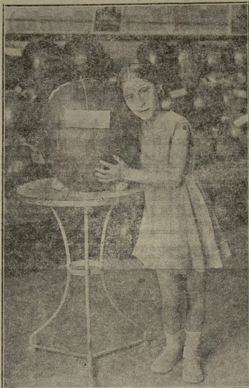
ESTE MAGNIFICO EJEMPLAR QUE PESA 42 KILOS, HA OBTENIDO EL PRIMER PREMIO EN EL CONCURSO QUE ACTUALMENTE SE CELEBRA

El comité ejecutivo de la Exposición obsequió a los presentes al año con una degollina de sandías y melones que puso la sala de autos al rojo vivo, ese color rojo propio de las sandías sabro-