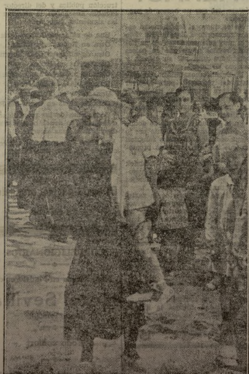
La emoción y alegría del momento la expresa esta madre que vio partir hace un mes a su hijo, amarillento y enfermizo, y se lo reintegran hoy sanote, rollizo... ¡hecho un hombre!