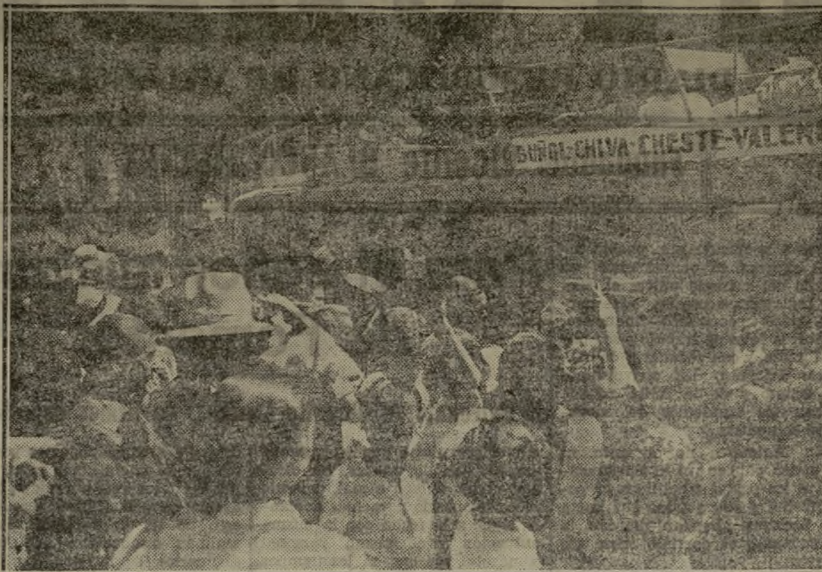
He aquí la segunda expedición de colonos de «Blasco Ibáñez», que van a Buñol, despedidos entusiasmáticamente en la Casa de la Democracia.