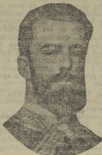
AMADEO DE SABOYA

La estancia en nuestra ciudad de Amadeo de Saboya, el rey caballero, como se le llamaba por antonomasia, dió singular relieve a la efemerides taurina que registramos, precisamente por cumplirse hoy sesenta años y porque las circunstancias políticas mueven a evocar un período que se quiso fuese renovador para España, como lo es el actual, si quiera la génesis revolucionaria no guardara paridad: la Revolución de 1868, aunque estaba en el ambiente, re-