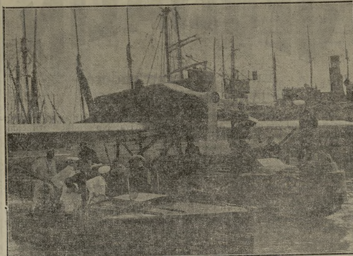
EL SEÑOR CASARES QUIROGA EN EL MOMENTO DE SUBIR A BORDO DEL HIDRO QUE LO CONDUCE A MAHÓN

Ayer por la mañana llegó a Valencia en el expreso de Madrid el ministro de Marina señor Casares Quiroga, quien como es sabido está realizando un viaje de inspección por las bases navales de la Península.