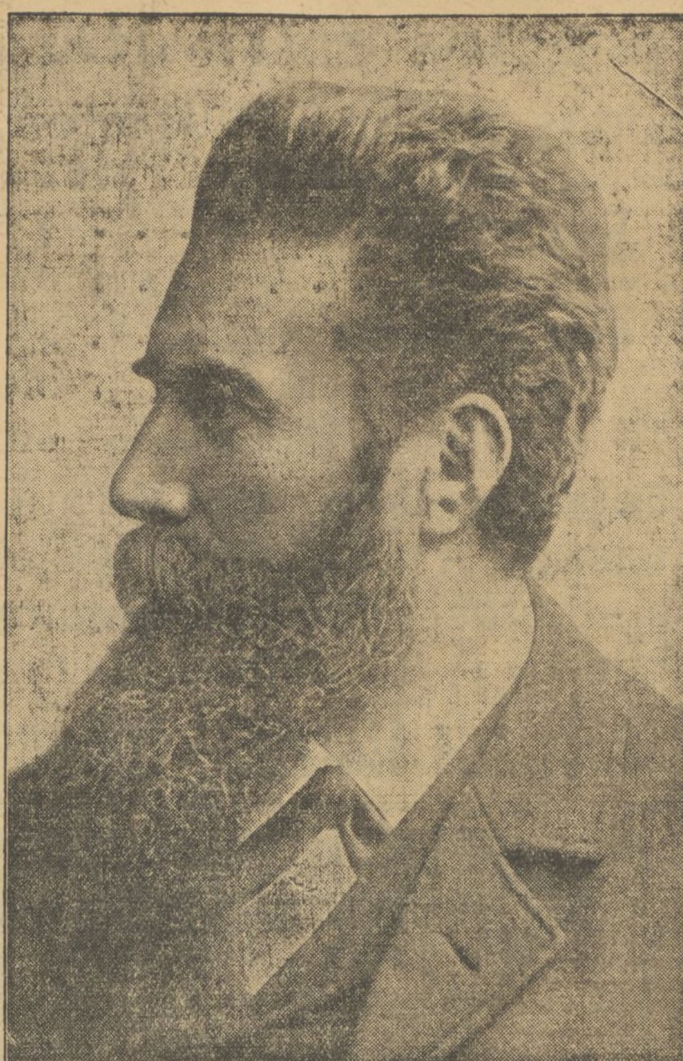
Wilhelm Conrad Roentgen, descubridor de los rayos de su nombre, más conocidos con el sobrenombre de Rayos X