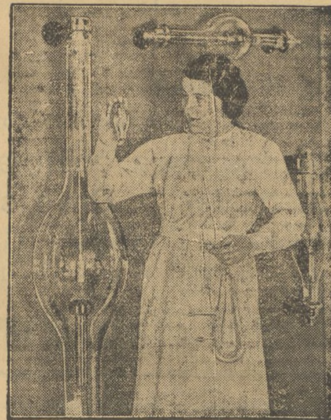
Detalle desde el primitivo tubo Roentgen al moderno

En la ciudad montañosa de Lennepe, la ciencia médica internacional va a rendir homenaje al que, con su vida, tanto hizo por la ciencia.