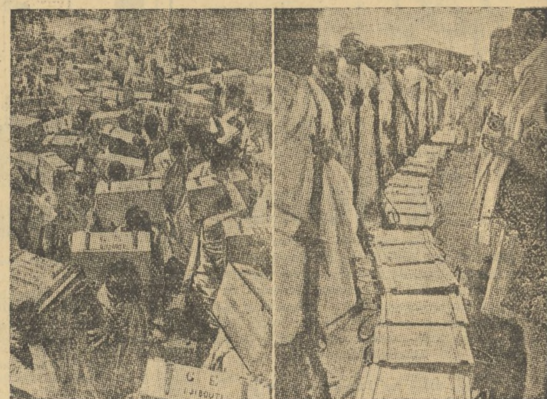
COMO LLEGAN LAS ARMAS A ABISINIA

Las cajas de armas y municiones son transportadas a hombros y a brazo. Hoy en día, en Abisinia, tener municiones equivale a tener dinero y antes de entrar en los almacenes las cajas, son objeto de un minucioso recuento