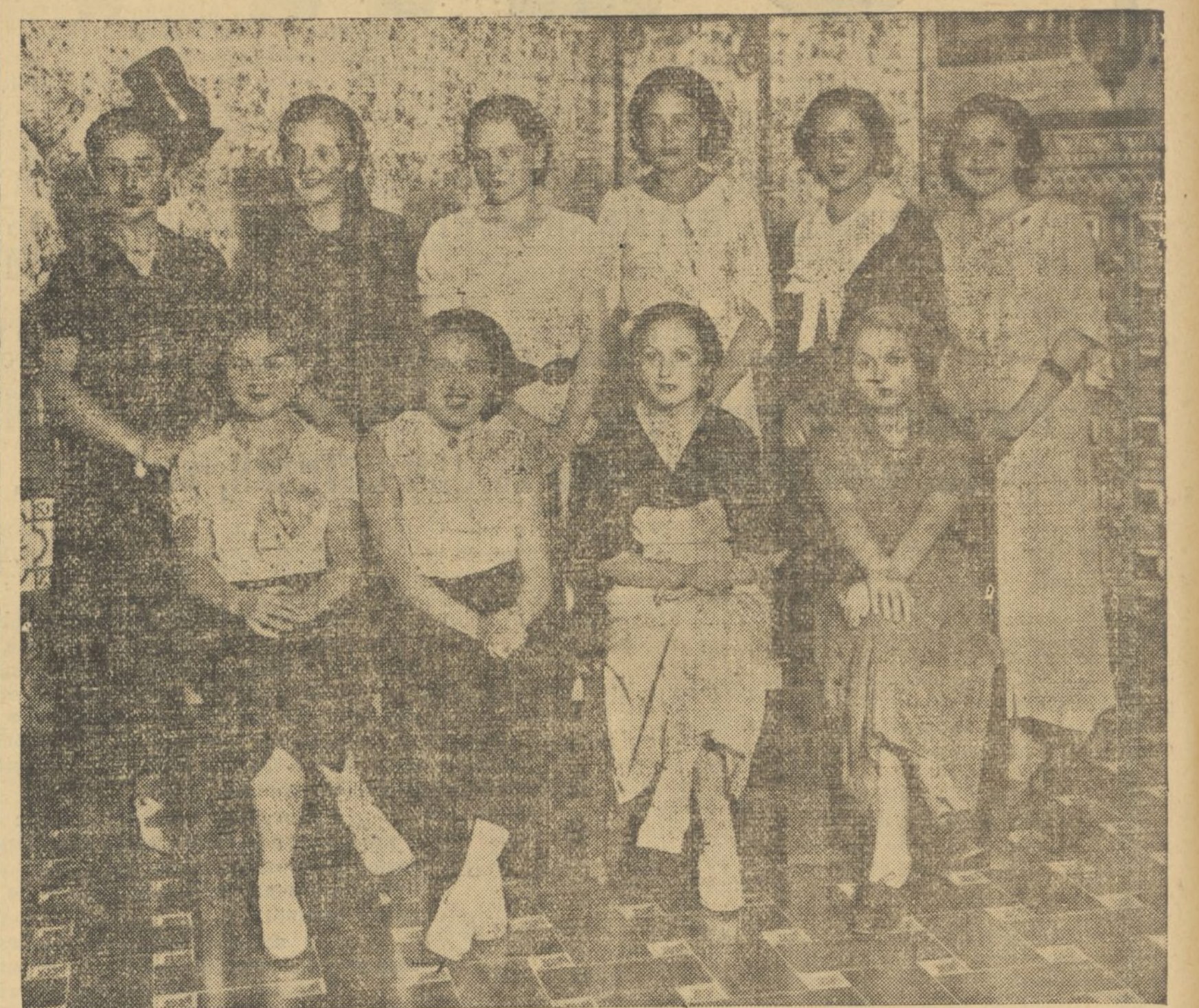
DIEZ DE LAS ONCE SEÑORITAS FINALISTAS QUE SE PRESENTARÁN EN LA FIESTA HOMENAJE A LA MUJER VALENCIANA LA NOCHE DEL 25, EN LOS VIVEROS, Y ENTRE LAS QUE EL PUBLICO PODRÁ ELEGIR LA «MUSA DE LA PRENSA»

Homenaje a la mujer valenciana.—Fiesta selecta, elegante y distinguida