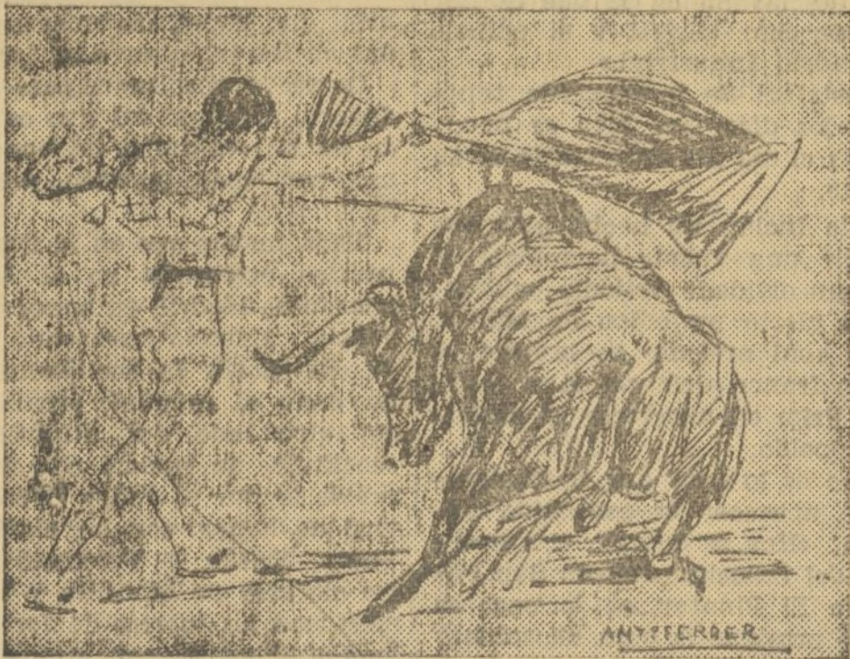
ORTEGA, EN SU PRIMERO

Recogió a su primero con unos lances insuperables, que