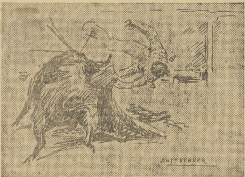
LA COGIDA DE VALENCIA II