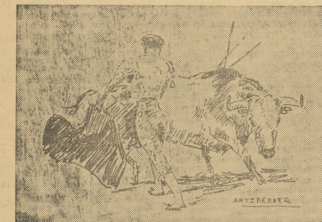
VALENCIA II EN EL ÚNICO TORO QUE MATO

En el que cerró plaza, estuvo el de Borox sencillamente enorme.