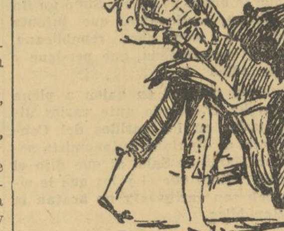
PERICÁS EN SU PRIMERO