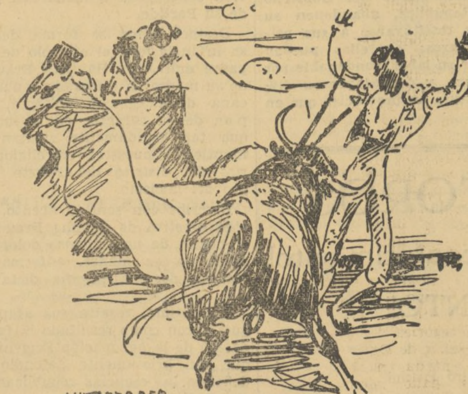
CEPEDA SALE COMPROMETIDO AL CLAVAR BANDERILLAS

RAFAELILLO. Rafaelazo recogió a su prime-