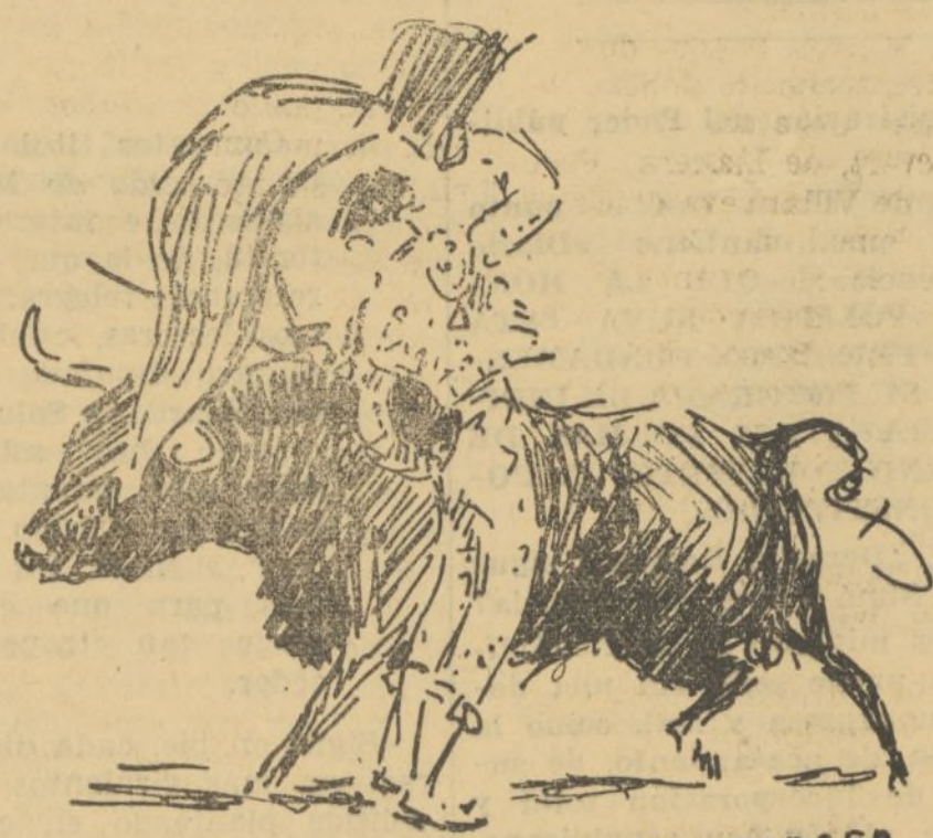
RAFAELILLO DURANTE LA FAENA DE MULETA A SU SEGUNDO

tumbar al Parladé de una entera colosal. Cortó las orejas del toro y el rabo, dando varias vueltas al ruedo entre aclamaciones. En su segundo, bastante que-