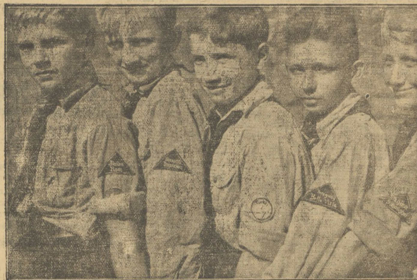
Niños de todo el mundo

Mas como estas dificultades no pueden entorpecer la aspiración de la República sobre superación intelectual y moral de los españoles; como las Cortes, en el ejercicio de su soberanía, han sancionado, con referencia al Ayuntamiento de Valencia, la ley de 11 de Febrero de 1934, por la que se concede la subvención de 26 millones 199.134'66 pesetas para la construcción de grupos escolares, estableciendo además los requisitos a que han de ajustarse las construcciones y facultando al ministerio de Instrucción pública para dictar las disposiciones necesarias a la mejor ejecución de la ley, hay necesidad de utilizar esta facultad en términos que represente la auténtica expresión de la ley sancionada y el mejor aseguramiento de su cabal efectividad. Con este objeto, teniendo en cuenta que la ley de 11 de Febrero de 1934 omite entre los requisitos que establece los que con la solemnidad de estos acuerdos municipales se relacionan; teniendo en cuenta que la facultad concedida en el artículo quinto autoriza dictar las normas a que han de ajustarse estas construcciones escolares, tanto en el orden técnico como en el financiero, como en el administrativo, a propuesta del ministro de Instrucción pública, con la especial conformidad de los señores ministros de Hacienda y Gobernación, por lo que afectan estas