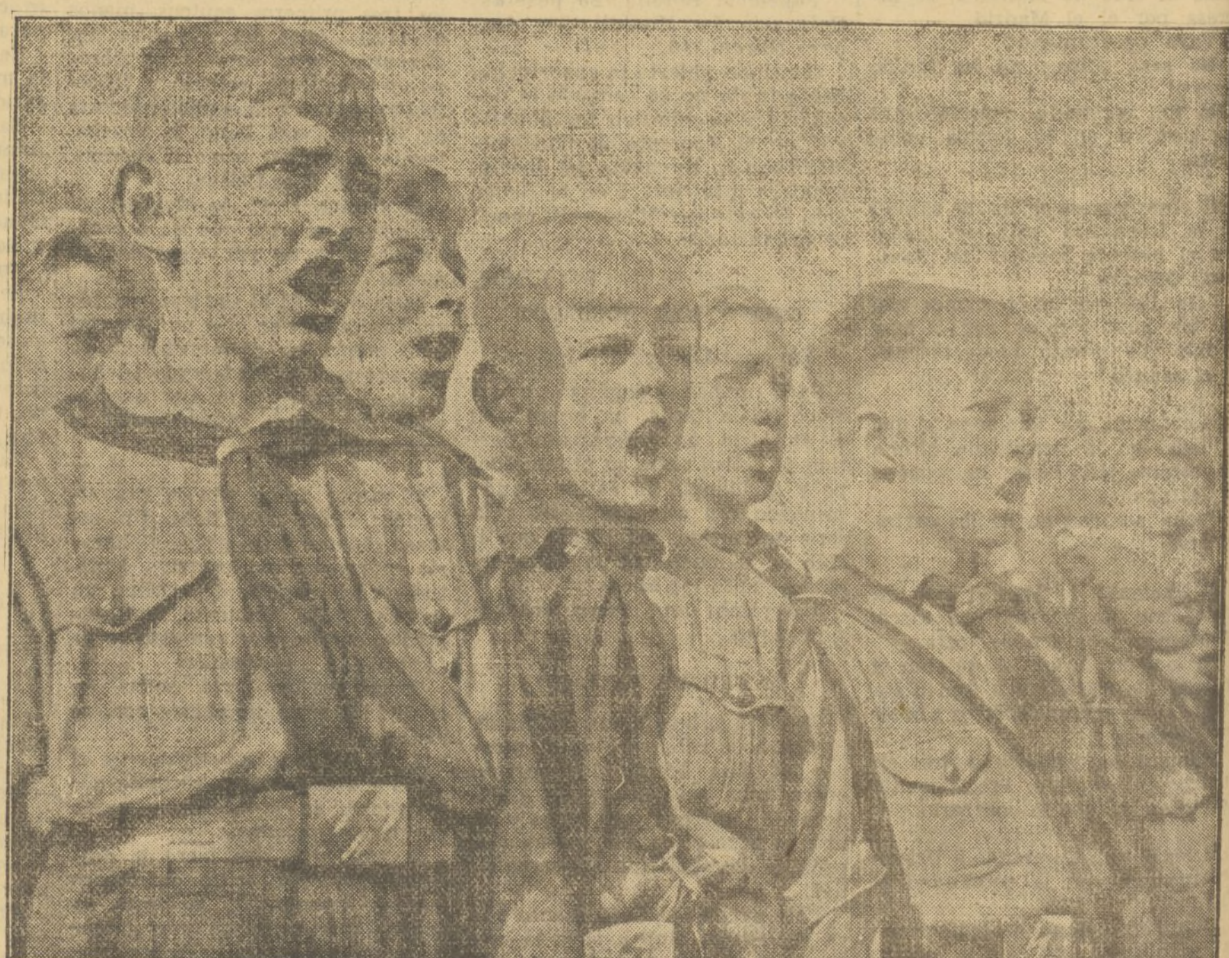
Una canción poco después que ha sali- do el sol, indica que ya se «vive» en la colonia

que las escuelas lleven el nom- bre de Blasco Ibáñez.