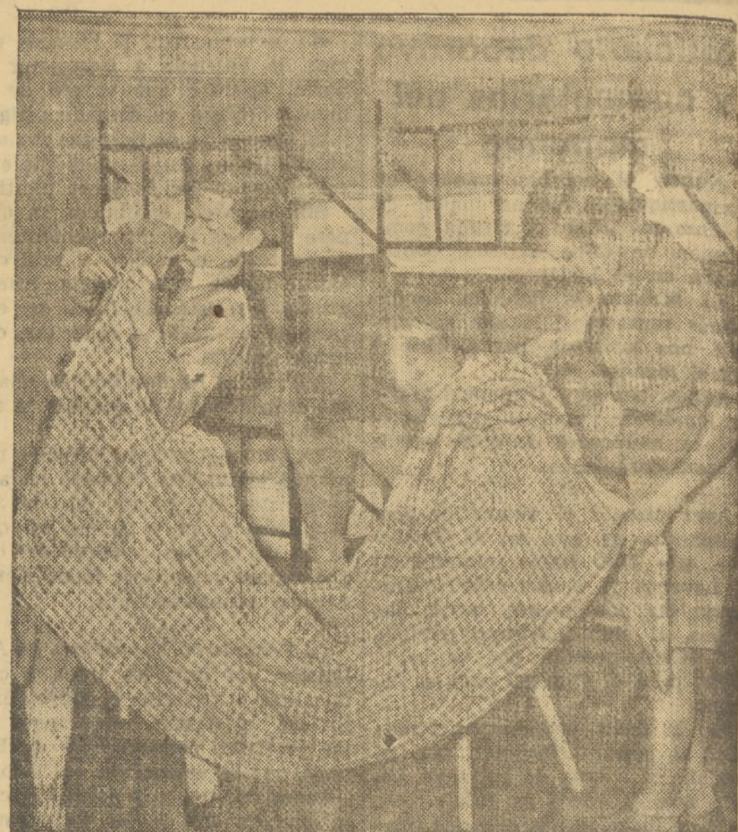
ALGO MAS QUE SALUD PARA EL CUERPO SE SACA EN LA ESTANCIA EN PLENO CAMPO. SE APRENDE A VIVIR. EN COR- TO RECINTO DE LA TIENDA DE CAMPAÑA HAY QUE HACER ESPACIO Y LA LEY DEL ORDEN Y EL ASEO DEBE INCLU- CARSE A LOS NIÑOS

Donde se disfruta de clima, allí donde el tiempo no tiene duras in- clemencias, unas tiendas de cam- paña acondicionadas y una expla- nada en el campo son suficientes. Con buena voluntad se llevará a los niños salud y alegría e incons- cientemente se laborará por la propia patria.