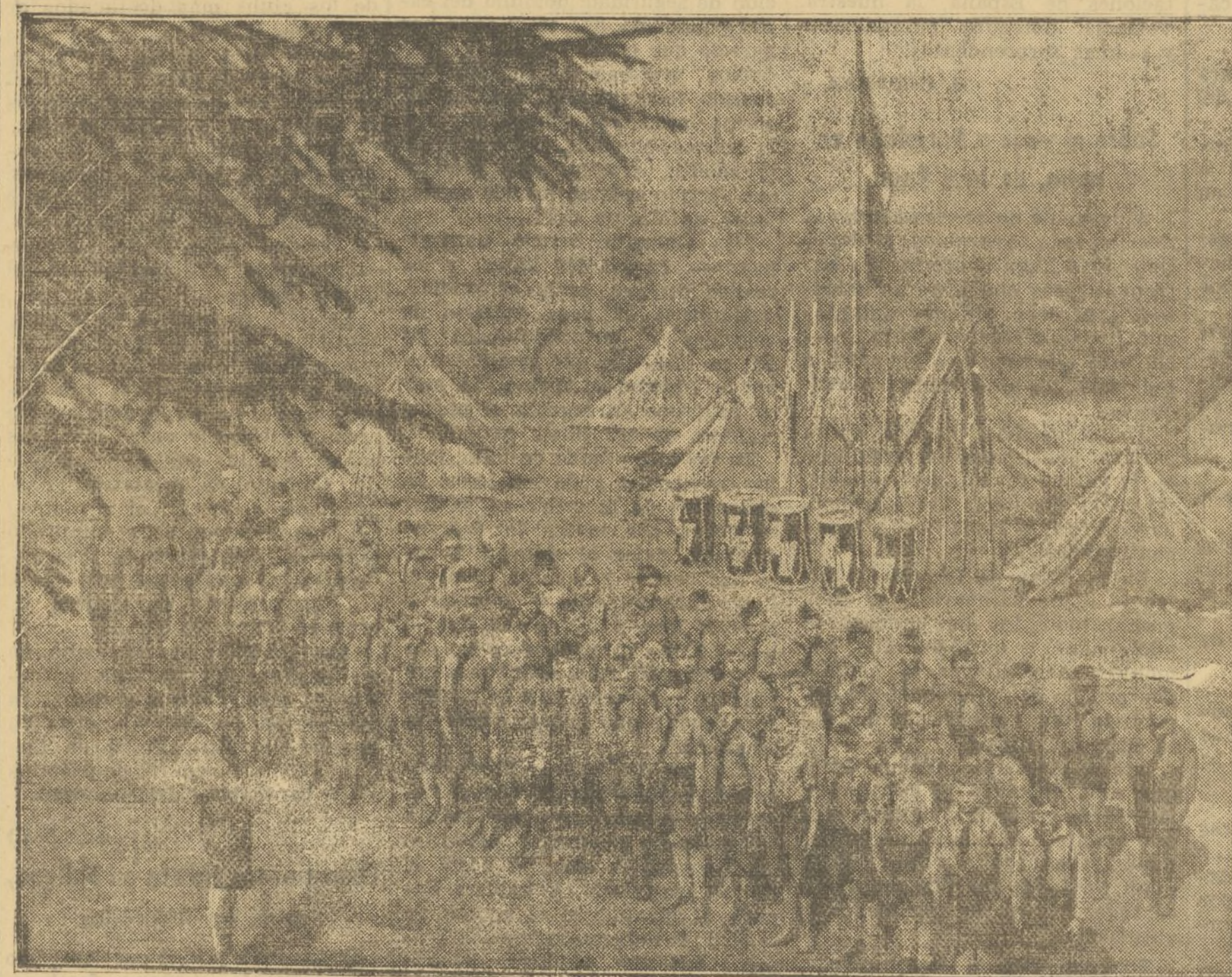
La bella perspectiva de una Colonia Es- colar en plena natu- raleza