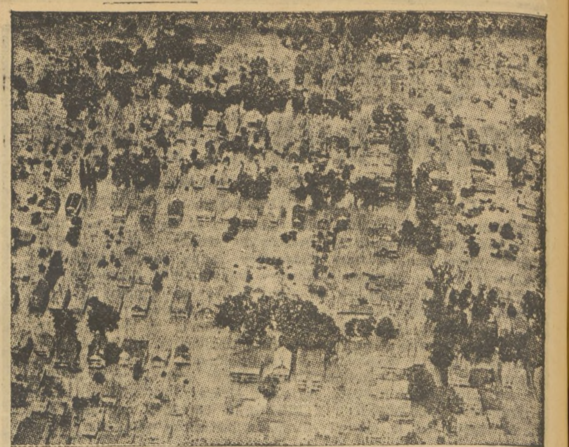
LAS LLUVIAS TORRENCIALES EN NUEVA YORK

Por las lluvias torrenciales se ha desbordado el río Chenago, en los alrededores de Nueva York. Si bien hoy hay que lamentar daños materiales, esta fotografía, lograda desde un avión, da la sensación de una ciudad de juguete