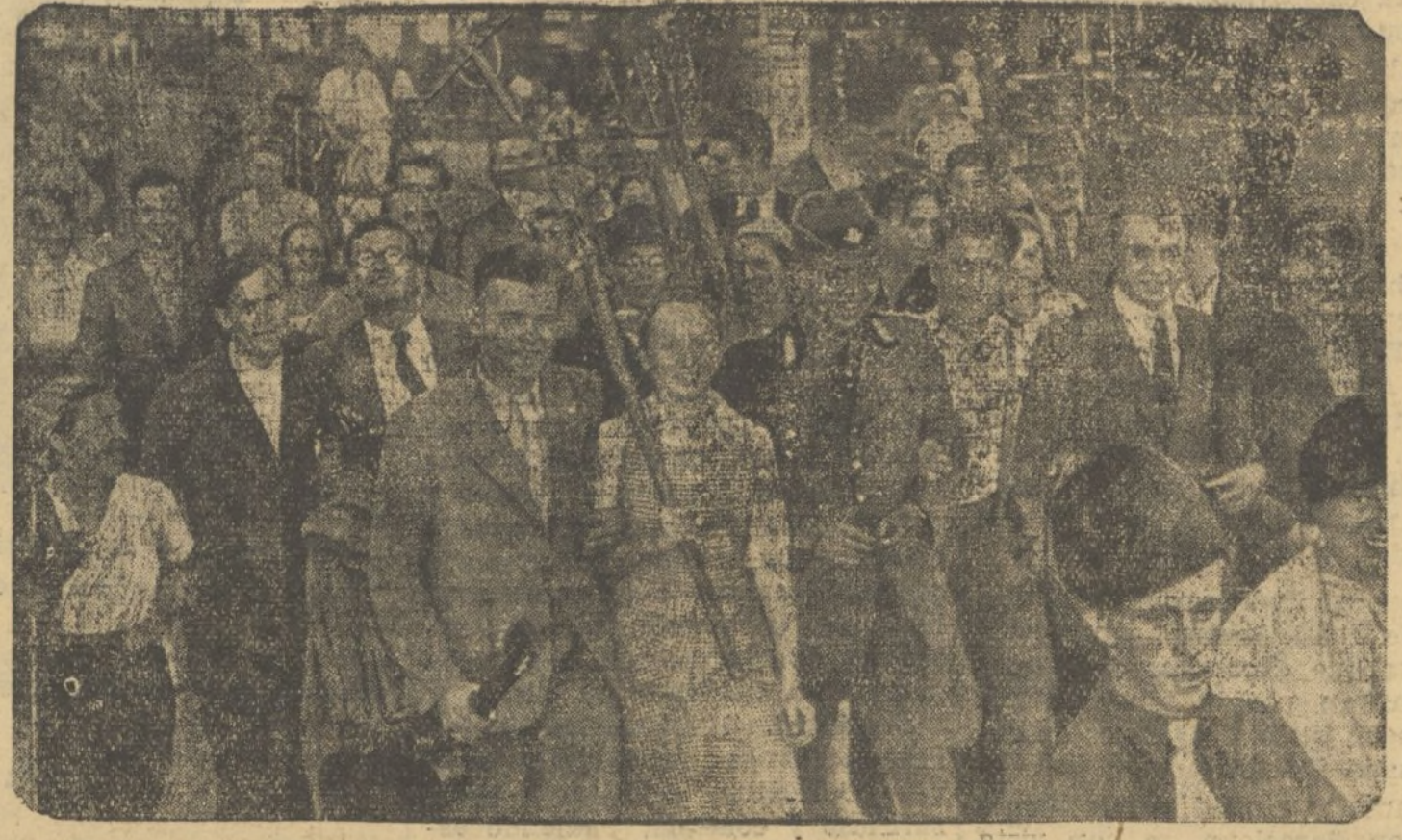
En la isla de Usedom los escolares franceses están pasando sus vacaciones con sus colegas alemanes. La residencia Insehof ha sido habilitada y la convivencia ha llegado a hacerse extensiva hasta los mismos moradores de la isla