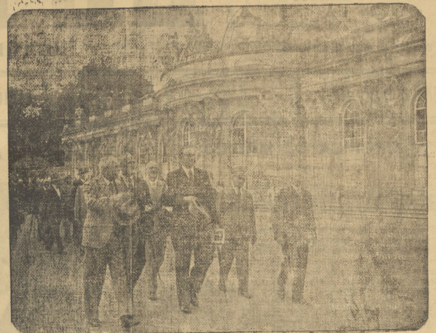
Los delegados de la British Legion, en su visita al Palacio de Sanssouci de Postdam. También visitaron el histórico Molino de Sanssouci, donde fueron obsequiados.