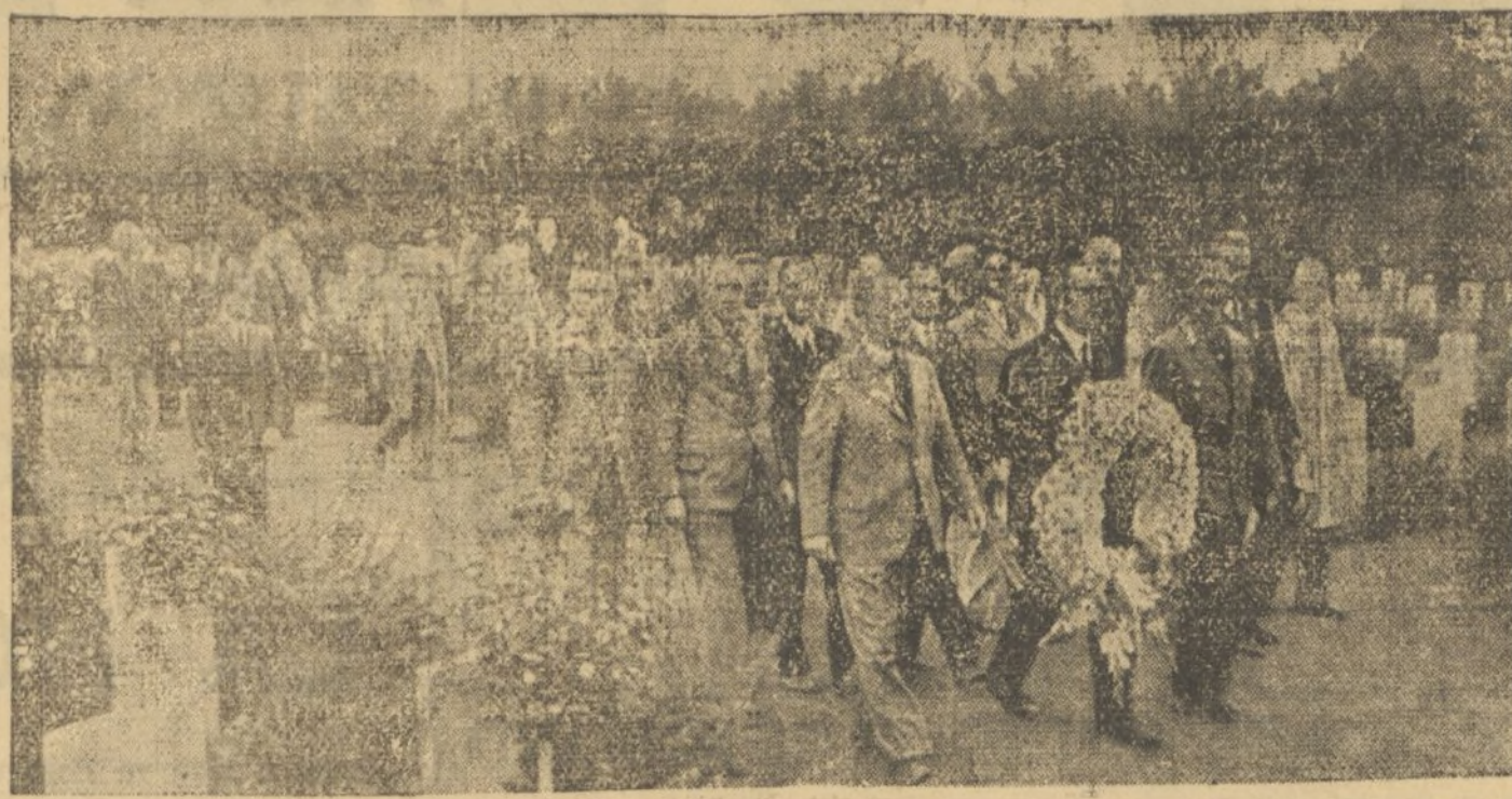
Los ex combatientes ingleses llegados a Hamburgo en número de veinticuatro, han colocado coronas en las tumbas de sus compatriotas enterrados en el pintoresco Cementerio de Ohlsdorf