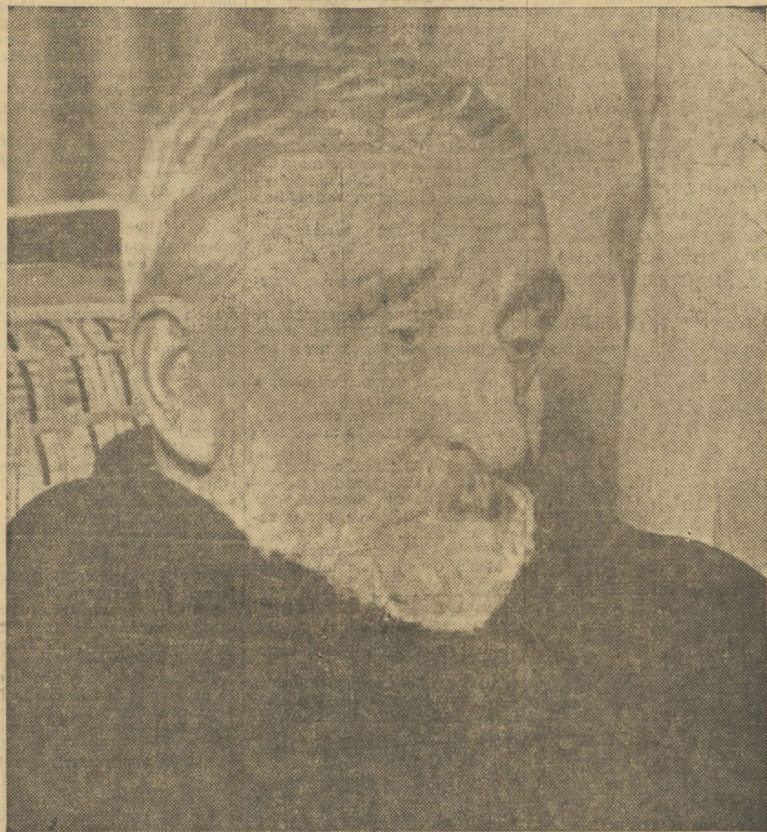
DON MANUEL B. COSSIO, PRIMER CIUDADANO DE LA REPUBLICA

«No quiero — ha dicho antes, sus primeras palabras del libro — que lo que a Rusia concierne, se tome desde el punto de vista de la actualidad ni que se aproveche para los hechos políticos. No he escrito estas páginas para que sean explotadas por tendencias materialistas opuestas a las mías. No es el todo político directo lo que me interesa en los problemas que tengo estudiados.