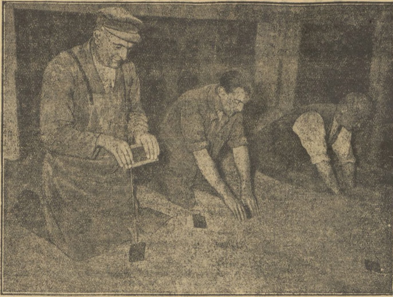
El empleo de gases venenosos para el saneamiento de cereales es una obra moderna de lucha contra los corcones de gran resultado. Cambiando las bolsitas entre los cereales, se consigue dejarlos a éstos en estado perfecto de sanidad