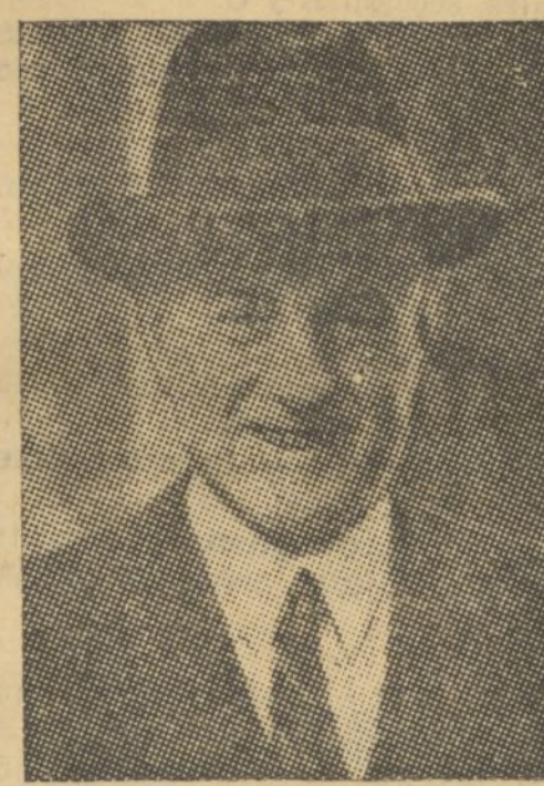
SIR SAMUEL HOARE que ha conmovido al mundo entero al pedir en Ginebra sanciones contra el país que altere la paz

«Le Journal» califica el discurso de sensacional, aunque afirma luego que después de las manifi-