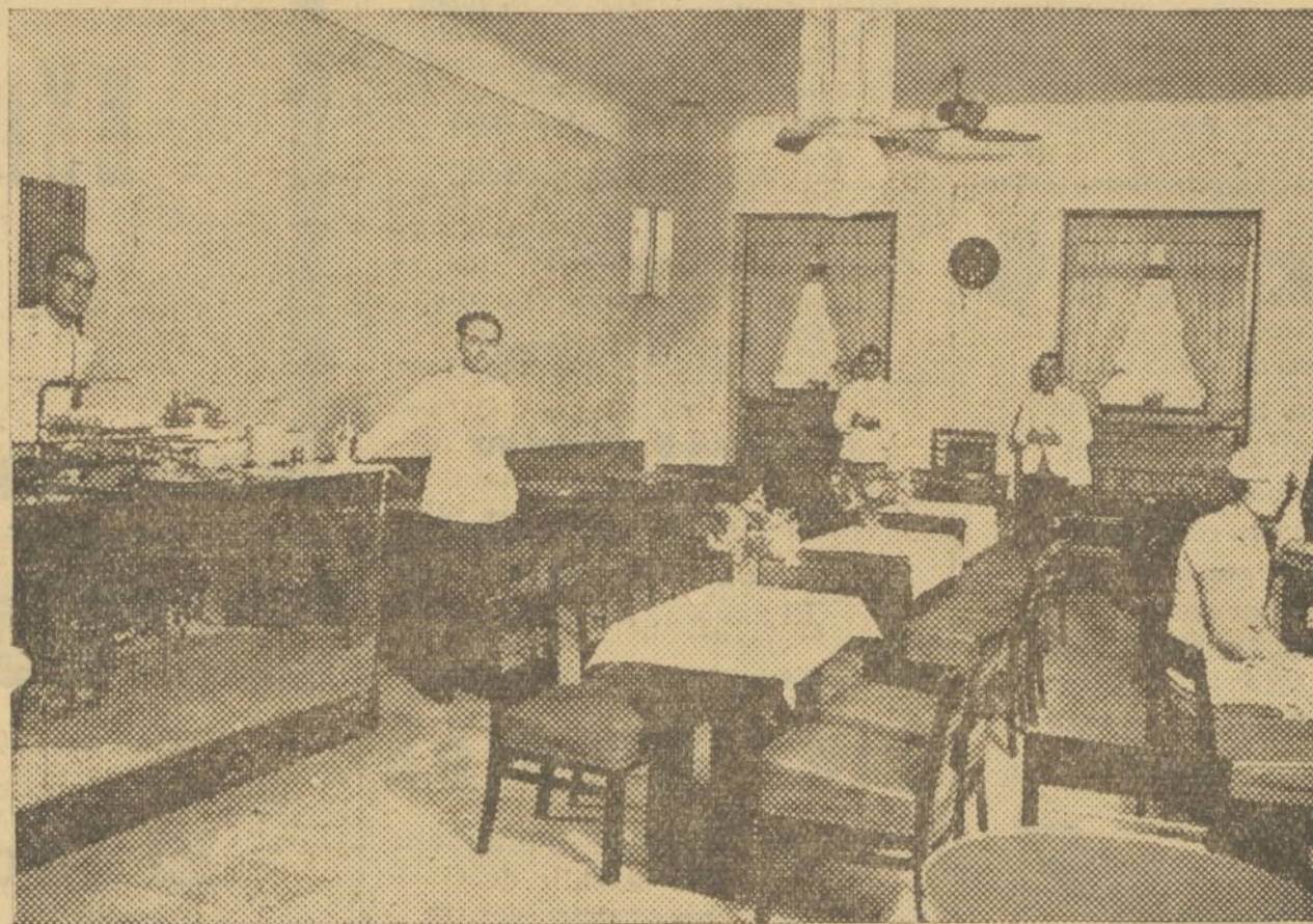
SALON DE TE EN EL «VIENA AUTOMATICO BAR»

Como usted habrá podido observar, el público queda completa-