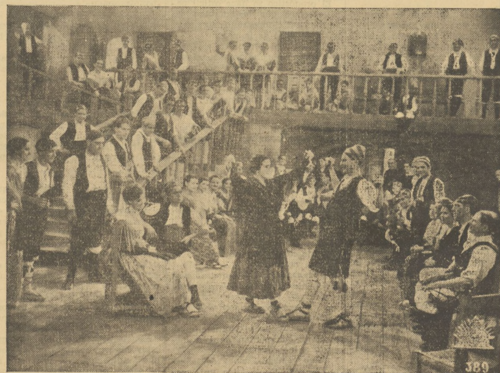
UNA ESCENA DE LA PRODUCCION NACIONAL «NOBLEZA BATURRA», EDITADA POR CIFESA, QUE VEREMOS EN ESTA TEMPORADA