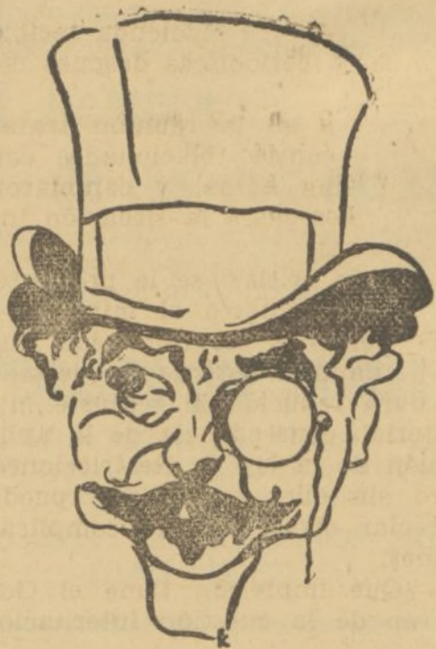
El actor cinematográfico Ralph Arthur Roberts, en su interpretación de «Hazme feliz»

«Currito de la Cruz», es la primera cinta de las que se proponen editar Producciones Ece-Febré & Blay, que esperan hacer de este film, una muestra digna de lo que se puede lograr en nuestra cinematografía y adelantar un paso más hacia la internacionalidad de nuestro cinema.