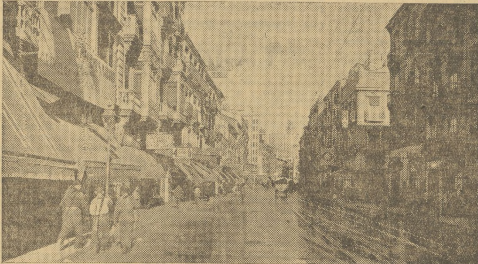
LA CALLE DE PÍ Y MARGALL