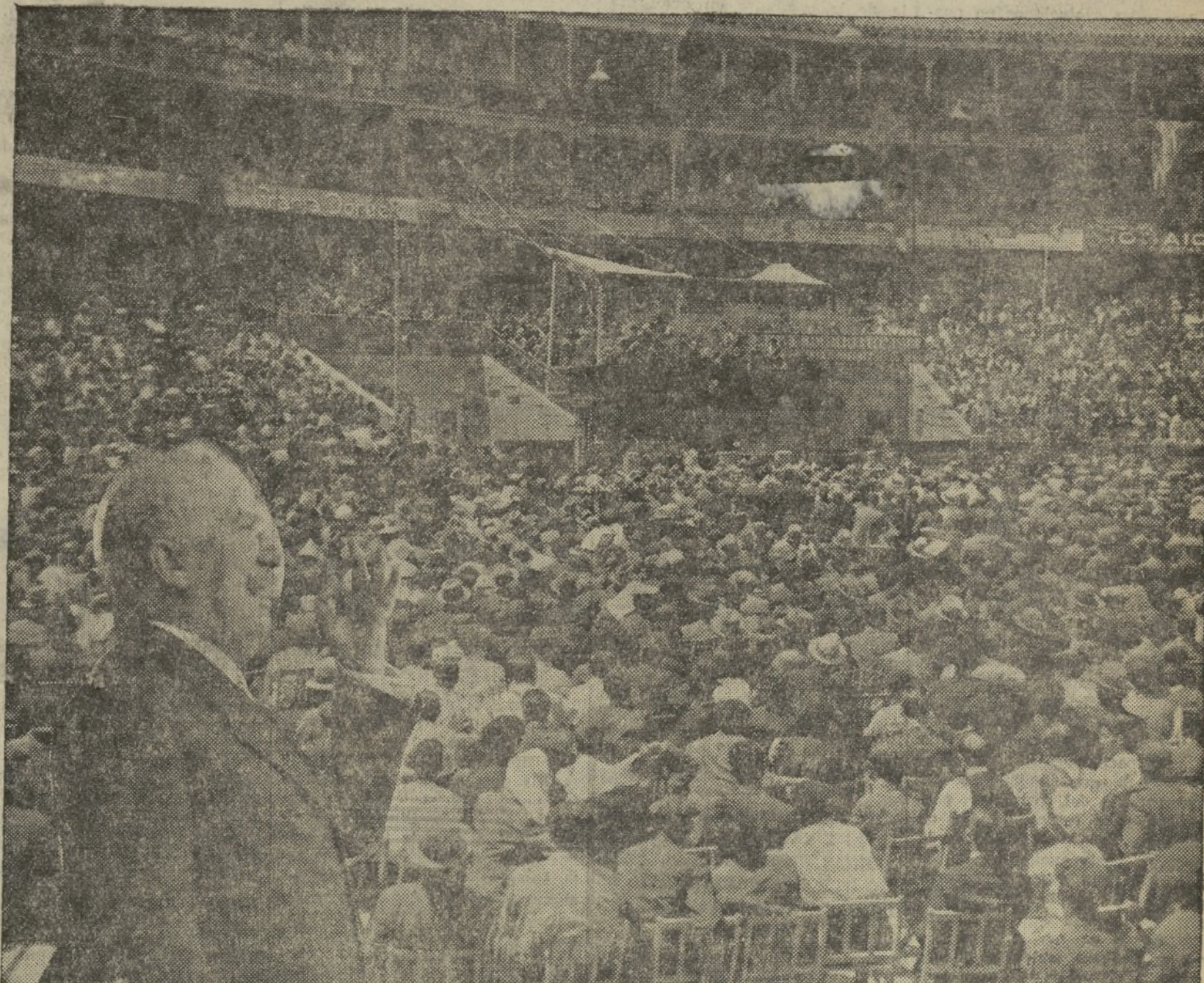
EL ILUSTRE REPUBLICO, DON ALEJANDRO LERROUX, EN UNO DE LOS MOMENTOS DE SU ELOCUENTE DISCURSO.—ASPECTO PARCIAL DE LA PLAZA DURANTE EL ACTO.

...de presencia ante vosotros en fines de propaganda más que de